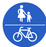
Verkehrszeichen 240 „Gemeinsamer Geh- und Radweg“