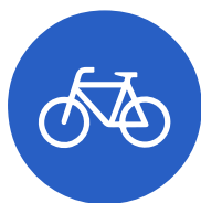
Verkehrszeichen 237 „Radweg“

Wenn der Gehweg durch das Verkehrszeichen 240 für Radfahrer freigegeben ist, darf auch dieser mit Fahrrädern befahren werden. Ansonsten dürfen nur Kinder bis zum vollendetem 10. Lebensjahr den Gehweg mit dem Rad befahren.