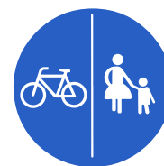
Verkehrszeichen 241 „Getrennter Rad- und Gehweg, Radweg links“

+++ Lohnt sich ein Einspruch gegen den Bußgeldbescheid? Prüfen Sie jetzt Ihre Möglichkeiten auf www.sos-verkehrsrecht.de ! +++