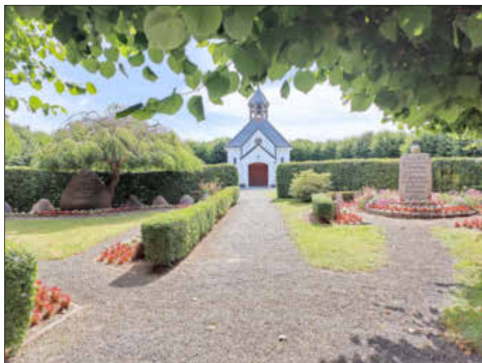
Die Kapelle auf dem Holmer Friedhof

An Bord der „Schlei-Prinzess“ durfte natürlich ein schönes Stück Torte und Kaffee nicht fehlen. Nach der Rückkehr im Hafen von Kappeln, ging es dann mit dem Bus durch die Landschaft Schwansen über Eckernförde und Rendsburg zurück nach Tellingstedt.