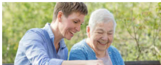
Bei einer professionellen Seniorenbetreuung erhalten ältere Menschen Anerkennung, Wertschätzung und soziale Teilhabe am gesellschaftlichen Leben. Wer als selbstständige Senioren-Assistentin beruflichen Erfolg haben will, sollte dafür gut gerüstet sein.

Gemeinsam mit anderen lässt sich die Selbstständigkeit viel leichter meistern: Viele Senioren-Assistenten vernetzen sich deshalb nach Abschluss der Ausbildung und schließen sich vor Ort in kleinen Teams oder Regionalgruppen zusammen. Gerade für frisch gebackene Senioren-Assistenten bedeutet dies, dass sie in ihrem neuen Beruf nicht als Einzelkämpfer agieren müssen. Außerdem erhalten sie die Möglichkeit, kostenfrei ein aussagekräftiges Profil ins Vermittlungsportal www.die-senioren-assistenten.de einzustellen. So lassen sich Kosten für eine eigene Webseite sparen und Kunden effektiver gewinnen.