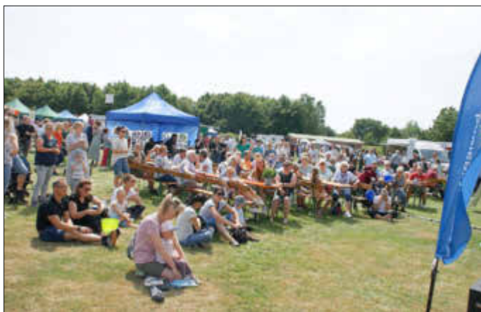
Viele Besucher verfolgten das Geschehen auf der Bühne.