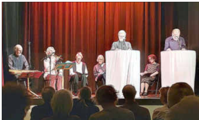
Foto von der Lesung in der Ditmarsia im Juni 2022

Sonntag, 28.08.2022 um 16 Uhr im KunstBilderHaus, Dorfstr. 26