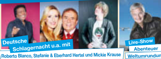
Deutsche Schlager Schlagnacht u.a. mit Roberto Blanco, Stefanie & Eberhard Hertel und Mickie Krause