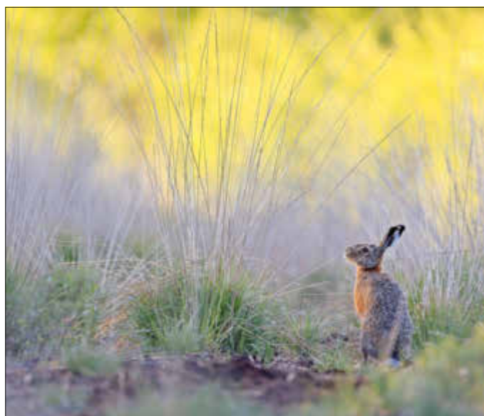
Anmutige Begegnung mit einem Feldhasen: Mit Uwe Naeve kommt man Flora und Fauna ganz nah.