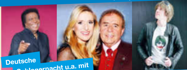
Deutsche Schlagermusik u.a. mit