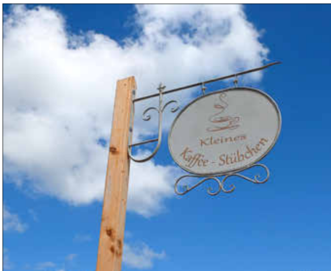
Weist den Gästen den Weg: Das Schild vor dem Kleinen Kaffee-Stübchen in Hemme.