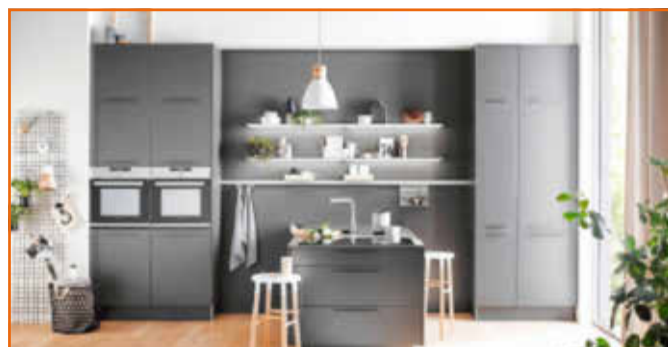
360° Ansichten die Lust machen auf Ihre neue Küche!

Wir begleiten Sie von der Idee, über die Planung, bis zur Montage. Jede Küche ist ein Unikat! Termine nach Vereinbarung!