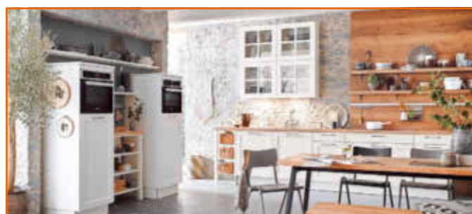
In allen Zeiten für Sie und Ihre Küche da, bei uns gibt es „fast“ alles rund um die Einbauküche!

Wir begleiten Sie von der Idee, über die Planung, bis zur Montage. Jede Küche ist ein Unikat! Termine nach Vereinbarung!