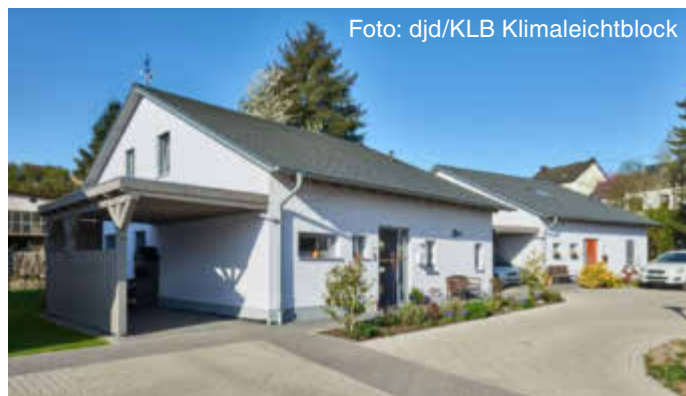
Häuser aus massivem Leichtbetonmauerwerk unterstützen ein gesundes Raumklima.